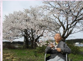
桜の木と記念撮影