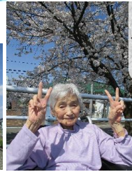
見附市総合体育館前

見附市内にある 人気の桜スポットへ ドライブして きました。 いつも遠くから 眺めていた 椿沢の一本桜。 木のふもとまで 行ってきました。