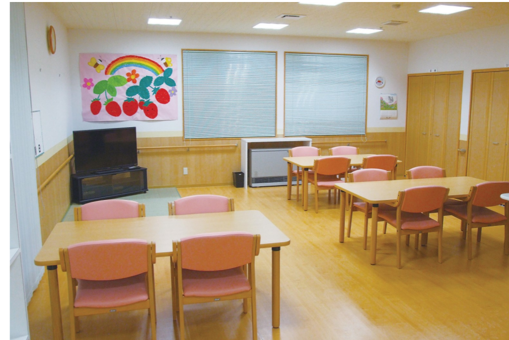
共同生活コーナー